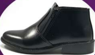
รองเท้าซาฟ