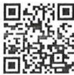
รายละเอียด

งานวิเทศสัมพันธ์ กองนโยบายและแผน โทร. ๐ ๒๖๖๕ ๓๗๗๗ ต่อ ๖๐๗๓ (ทงนงค์) อีเมล tanong.p@rmutp.ac.th