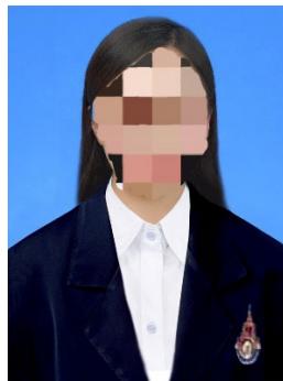
ตัวอย่าง