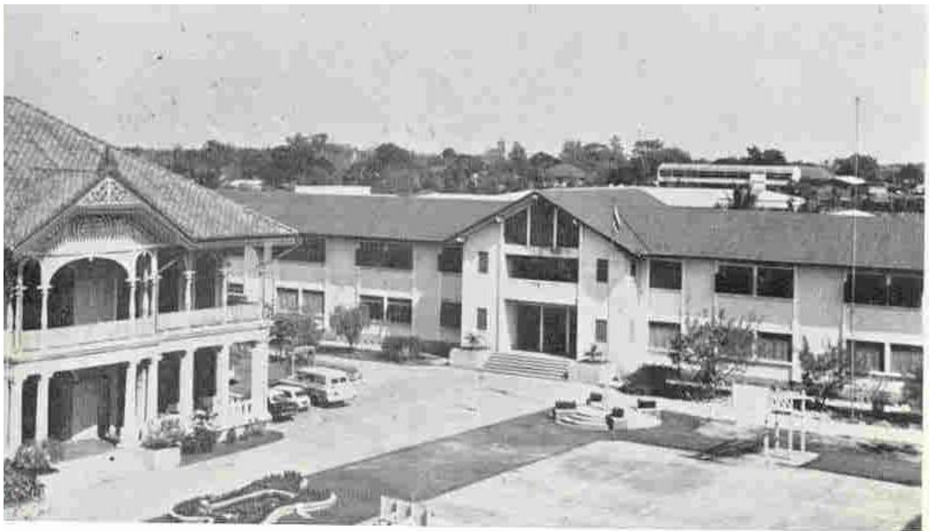
อาคารเรียนตึก ๒ ชั้น หลังแรก

พ.ศ. ๒๕๔๖ มีการจัดสร้างอาคารเรียนเป็นตึก ๒ ชั้น ๑ หลัง ความยาว ๖๔ เมตร ทางด้านขวามือตรง ทางเข้าโรงเรียน สิ้นค่าก่อสร้าง ๑,๒๐๐๐,๐๐๐ บาท