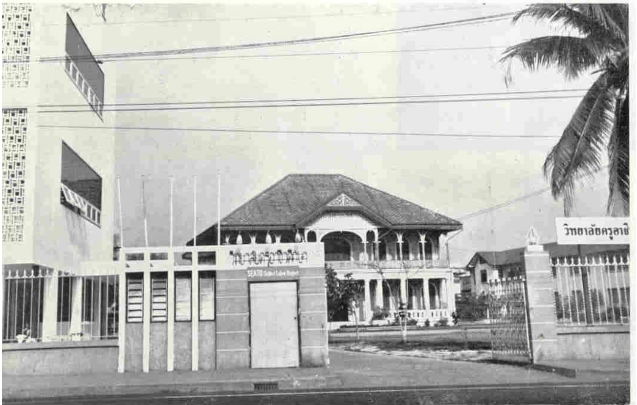
ประตูทางเข้าวิทยาลัยครูอาชีพศึกษา

พ.ศ. ๒๔๙๗ โรงเรียนฝึกหัดครูอาชีพศึกษาได้รับงบประมาณเพื่อต่อเติมอาคารเรียนตึก ๒ ชั้น ที่สร้างเอาไว้แล้วเพิ่มความยาวออกไปอีก ๔๔ เมตร, ซ่อมแซมตึกวังรพีพัฒน์เดิมที่ชำรุด, ทำรั้วและถนนภายใน, ย้ายห้องแถวที่ด้านหน้าออกไป, และปลูกสร้างบ้านพักภารโรง