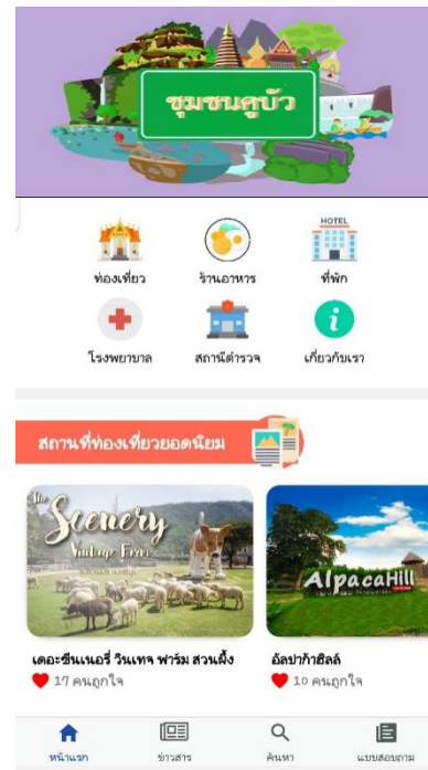
หน้าจอหลัก