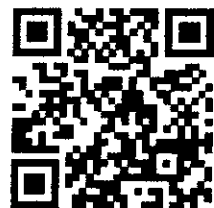
QR Code แบบฟอร์มส่ง แผนปฏิบัติงานประจำปี ๒๕๖๖

โครงการอนุรักษ์พันธุกรรมพืชอันเนื่องมาจากพระราชดำริฯ