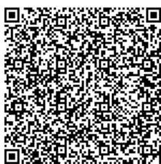
ศูนย์เทเวศร์ มทร.พระนคร