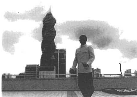
ชุดไทยไปปานามา